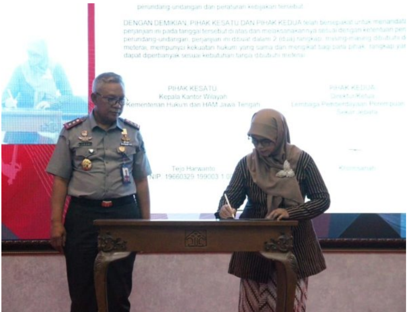
Kemenkumham Jateng Kerja Sama dengan 60 OBH, Beri Bantuan Hukum Gratis kepada Masyarakat